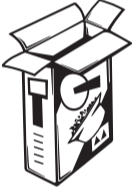
جميع أنواع الورق والكرتون